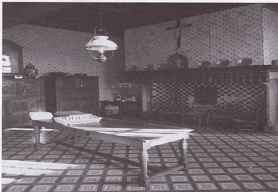
Keuken van de abdij volledig betegeld met 18de-eeuwse tegels met afbeeldingen van kinderspelen.

Omdat godsdienstmoeilijkheden in de laatste decennia van de 16de eeuw het Vlaamse platteland onveilig maakten, vestigden verschillende kloostergemeenschappen zich zowat overal binnen veilige stadsmuren. De benedictinessen van Gistel zochten in 1586 hun toevlucht in Brugge en vestigden zich na een lange zoektocht definitief in de Boeveriestraat in 1626. Uit financiële noodzaak is het klooster in het begin kleinschalig, maar het breidt zich langzaam uit, dankzij schenkingen en bijkomende aankopen. Het eigendom beslaat dertien percelen in de Zestendelen van Onze-Lieve-Vrouw (de nrs. 303 t.e.m. 315) met daarachter een groot huis en een erf met een poort. Het grenst aan het gasthuis van Sint-Juliaans aan de zuidkant, een waterloop aan de oostkant en liep tot aan het godshuis Van Peenen in de Gloribusstraat. De Sint-Godelieveabdij is een uitzonderlijk goed bewaard kloostercomplex in West-Brugge en