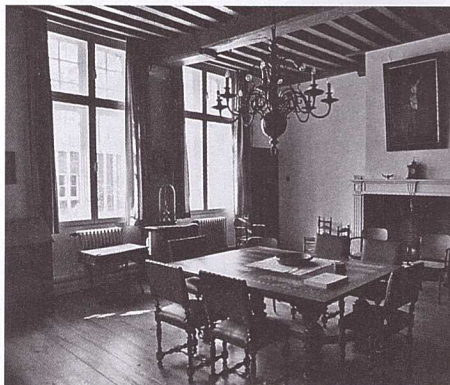
Kamer van de abdis in de 17de-eeuwse zuid-vleugel.

De Godelieveabdij in de Boeveriestraat is voor Brugge Foundation een gidsproject. Wij zijn er vast van overtuigd dat alle elementen er zijn om het prachtige geheel een betekenisvolle toekomst te geven. Deze plek was eeuwenlang bijzonder. Een huis van en voor vrouwen. Een stilteplek ook. Brugge Foundation wil dat de nieuwe bestemming in de lijn ligt van de eigenheid en de ziel van de voormalige abdij. De 'geest van de plek' is daarvoor een ideale inspiratiebron. Brugge Foundation wil alles in het werk stellen om hiervoor fondsen te verzamelen. Ook u kunt Brugge Foundation steunen, zelfs op verschillende manieren. U kunt een gift storten via onze website of rechtstreeks op rek. BE59 5230 8078 6426. U kunt ook aan Brugge Foundation denken via een gift in uw testament. Of misschien wilt u zich als vrijwilliger bij ons aansluiten? U vindt alle informatie op onze website www.bruggefoundation.be .